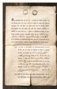
Sursă istorică scrisă (document)