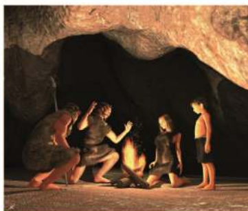
Peșteră. Locuință preistorică