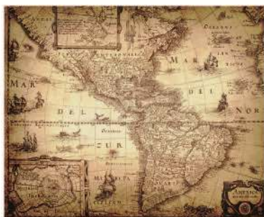
Hartă (sec. XVII)