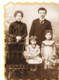
Fotografie (sec. XIX)