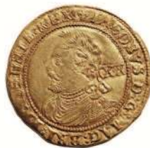
Monedă medievală (Anglia)