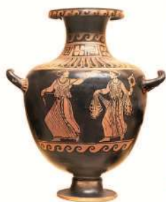
Vas antic (Grecia)