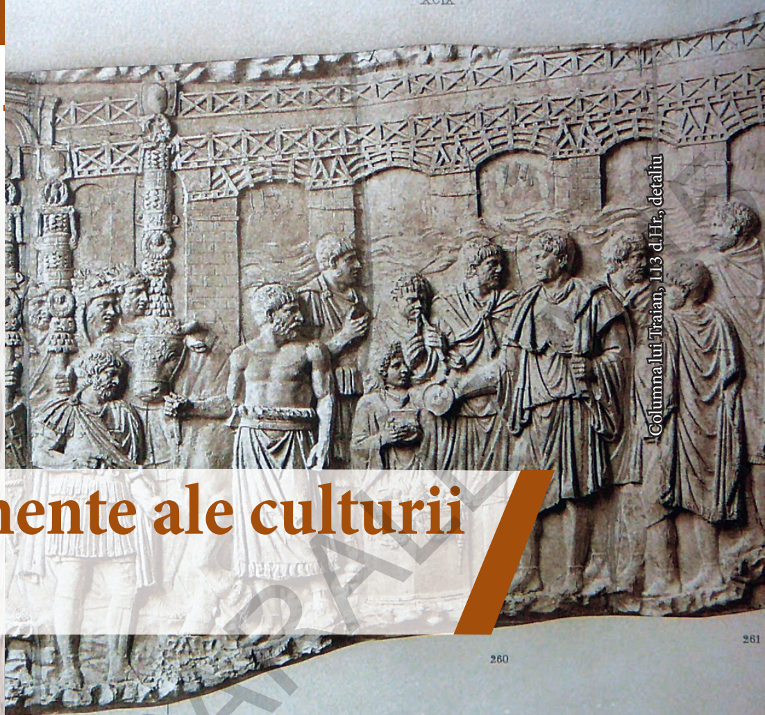
Columna lui Traian, 113 d.Hr., detaliu