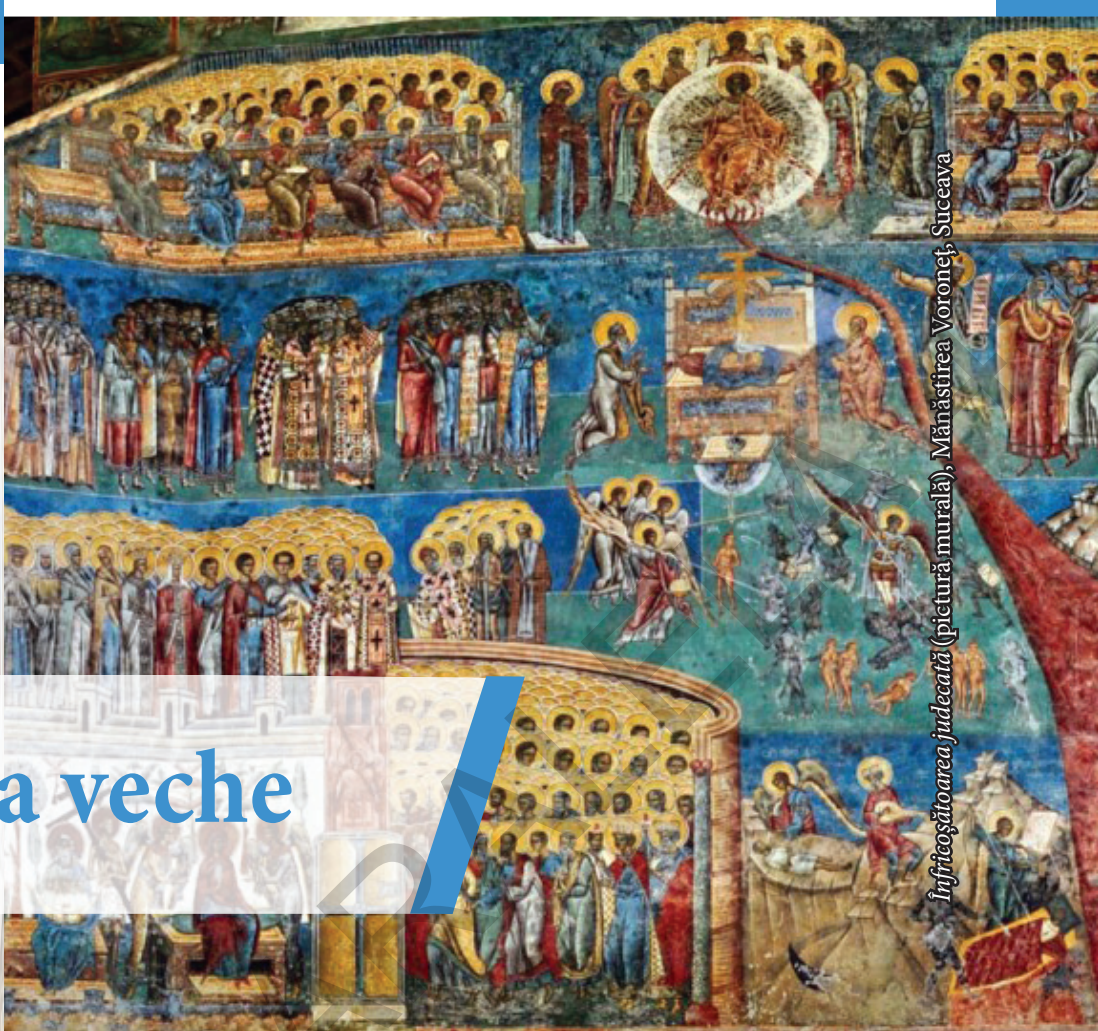
Înfricoșătoarea judecată (pictură murală), Mănăstirea Voroneț, Suceava