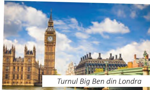
Turnul Big Ben din Londra