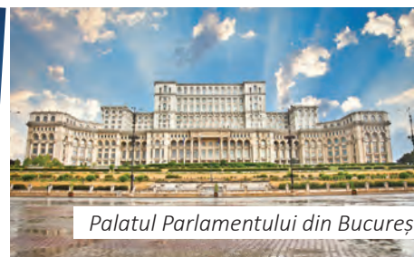
Palatul Parlamentului din București