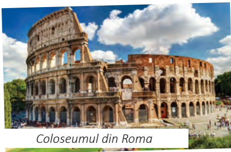
Coloseumul din Roma