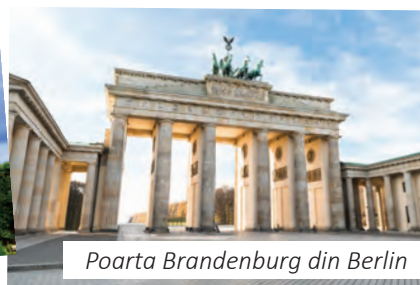
Poarta Brandenburg din Berlin