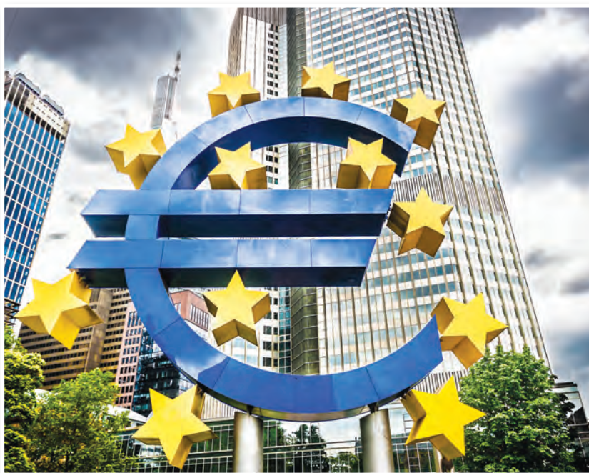
Banca Centrală a Uniunii Europene