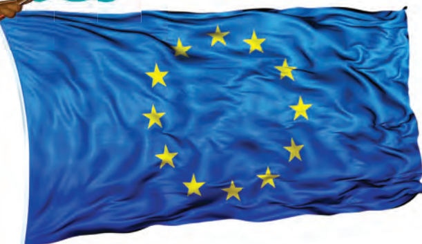
Steagul Uniunii Europene