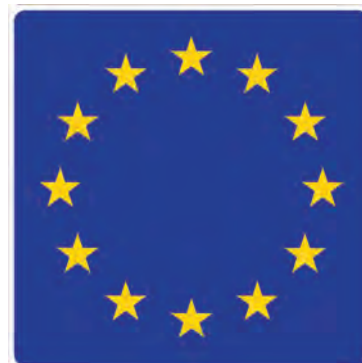
Sigla Uniunii Europene