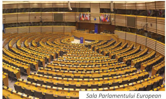
Sala Parlamentului European