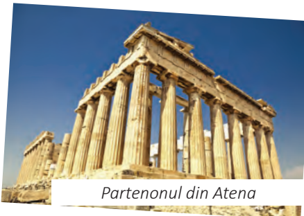
Partenonul din Atena