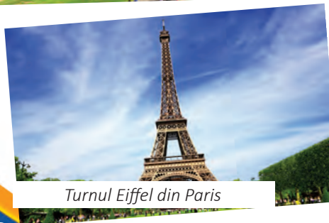
Turnul Eiffel din Paris