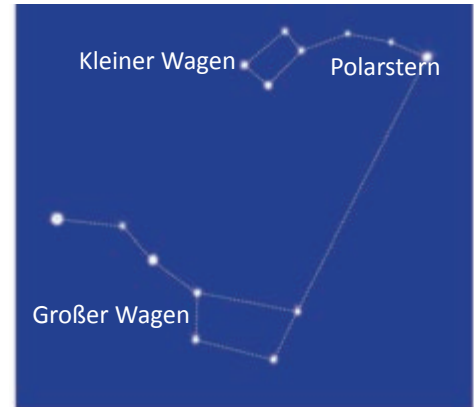
Abb.2 Der Polarstern