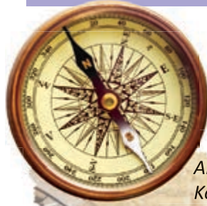
Abb.1 Der Kompass