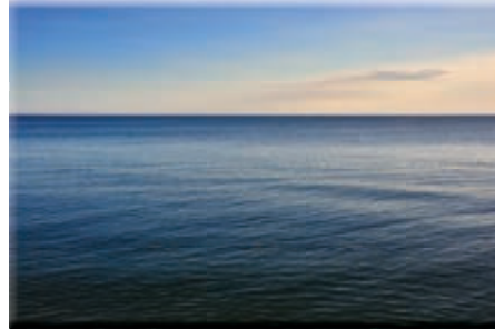
Abb.1 Die Horizontlinie

„Das Schiff teilt das Wasser. Im Norden und Westen erheben sich Berge, Wellen gleich. Ein Berg sperrt den Weg der Donau. Diese fließt am Berg vorbei und dann eine Weile nach Osten. Der Horizont weitet sich und gibt den Blick auf die Gefilde des Landes frei.“