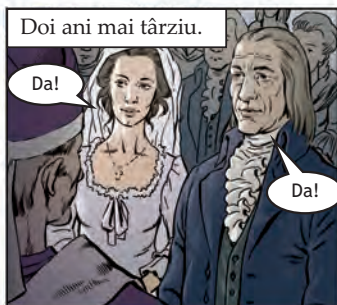
Doi ani mai târziu.